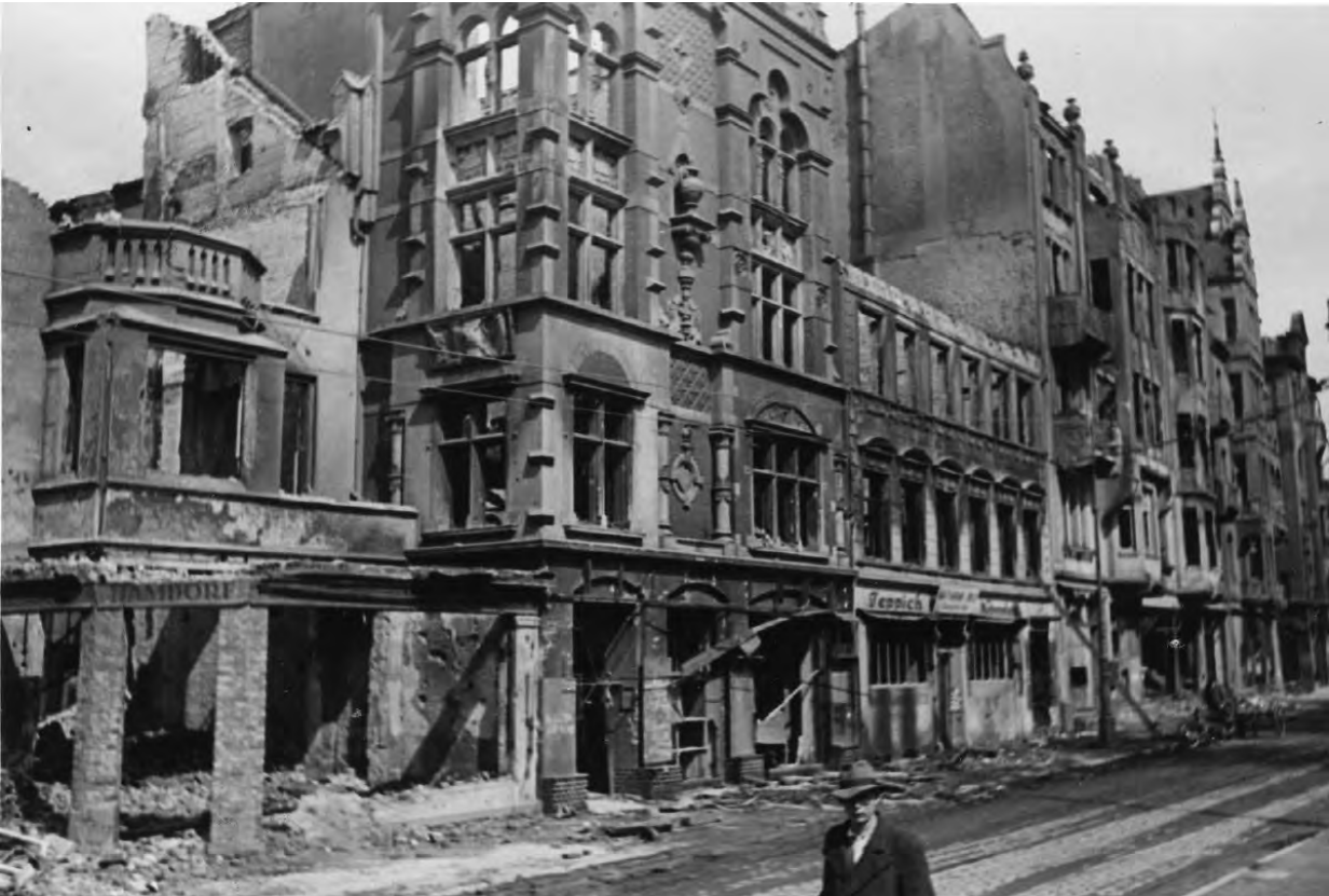
Der zerstörte Schlossgarten nach dem Luftangriff auf Kiel am 22.05.1944