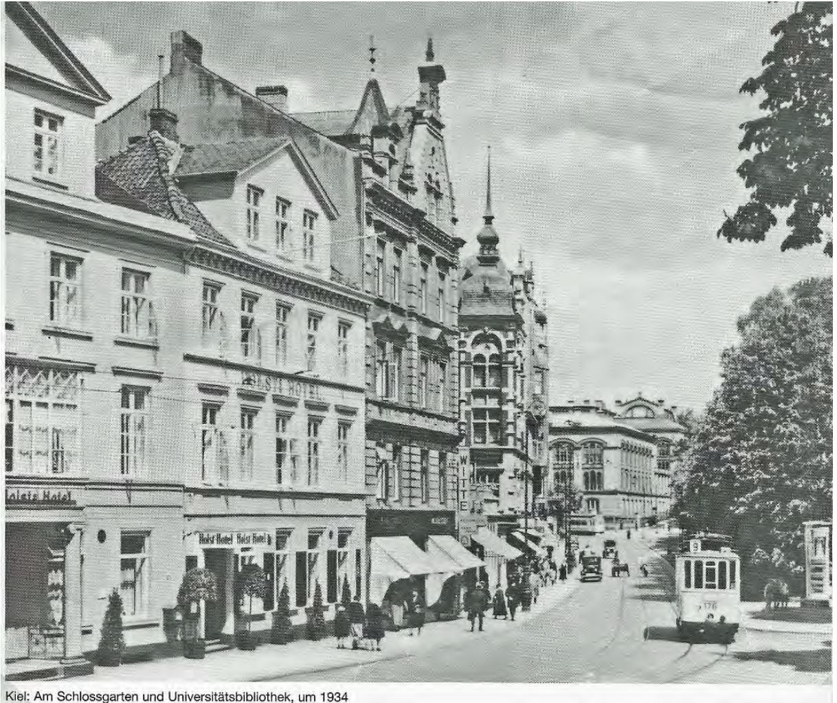
Kiel: Am Schlossgarten und Universitätsbibliothek, um 1934

Ein Rückblick auf drei Generationen, die die Geschicke der Kieler Firma lenkten